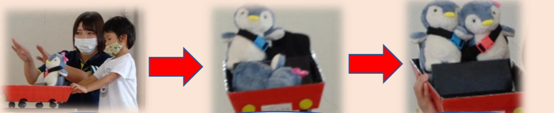
もし、事故にあったらどうなる？