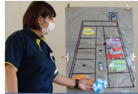
駐車場では…必ず大人の人に手をつないでもらって！