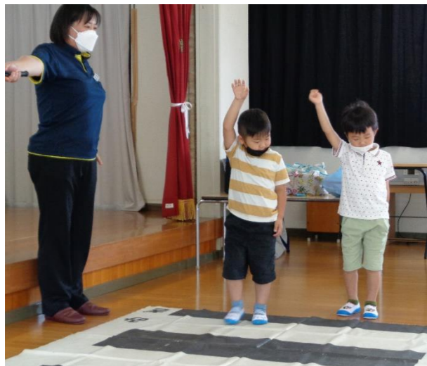
横断歩道を渡ってみよう！ くじら組さん

「シートベルトをしていますか？」「駐車場であそんだり、一人で歩いたりしていませんか？」…ちょっと返事に困る場面もありましたがきっと今日のお話が心に残っているはず！お家の人とお約束の話ができるといいですね！