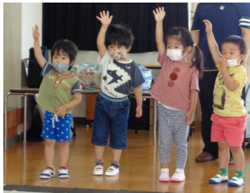
手を挙げて…上手！！ らっこ組さん